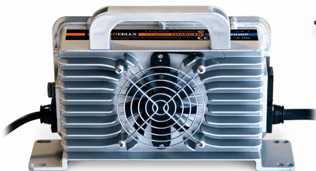
De waterdichte JAROCELLS 22A lader