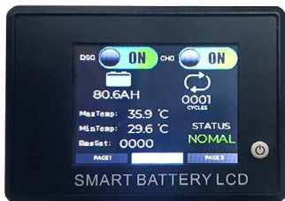
Display voor montage in een dashboard om real time de status van de accu af te lezen