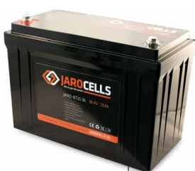
BT125.12 BT50.24 BT25.36