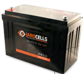
BT125.12 BT50.24 BT25.36