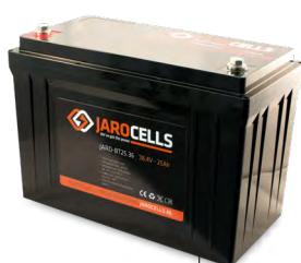
BT125.12 BT50.24 BT25.36